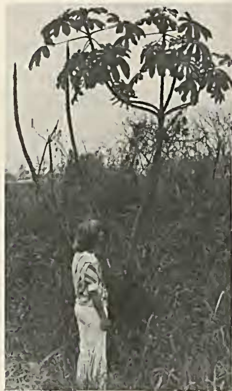
Figura 1 Hábito da planta feminina.

(Nectar of Cecropia lyratiloba Miq. var. nana Andr. & Car. — Cecropiaceae ). It is a new source of food utilized by the ants Azteca which live in Cecropia : the nectar. The relict character of the nectaries is here considered. The drop of nectar it seems important in the pollen captation and germination.